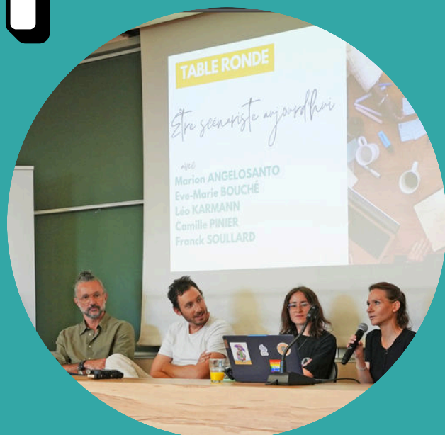
Table ronde "métier" réunissant l'ensemble des scénaristes intervenants